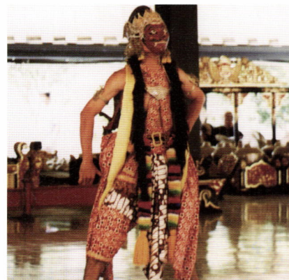
ジョグジャカルタ王宮の歴史物語の踊り手

有名なラーマヤナなどを見ても、日本の歌舞伎に通ずるところもあり、アジアの文化は我々の背景であると実感せざるを得なかった。